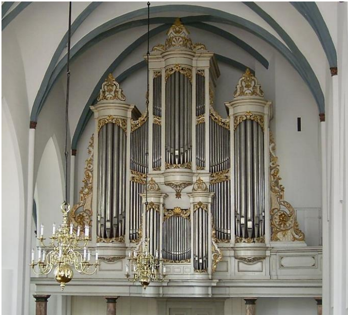
Foto: Van Dam Pels orgel na restauratie 2021 / Berend van Steenbeek