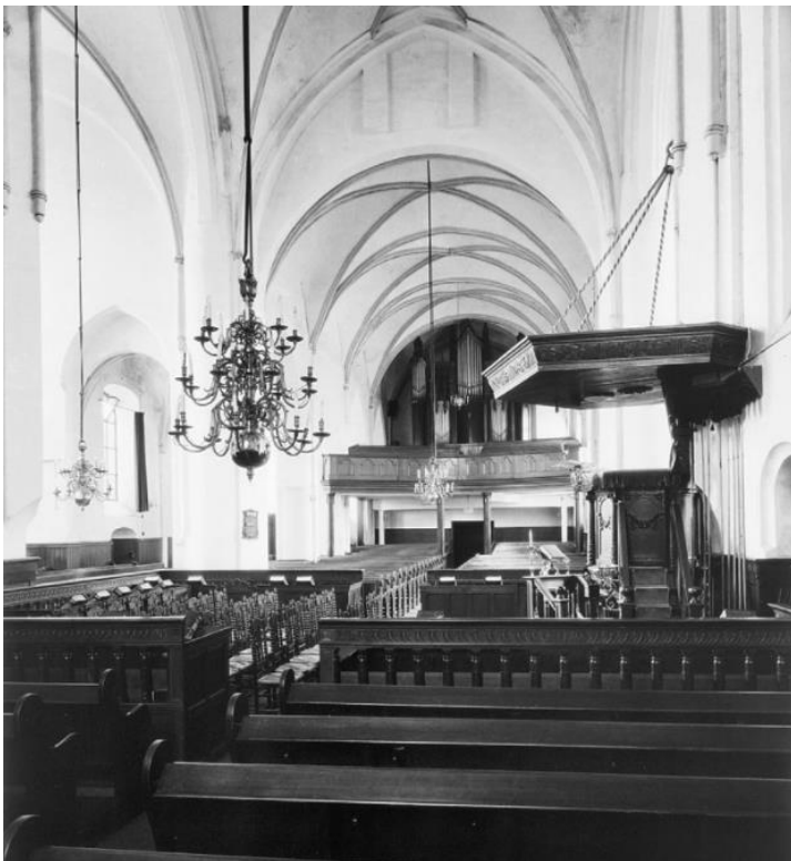
Foto: Het aangepaste Schwartz orgel rond 1955