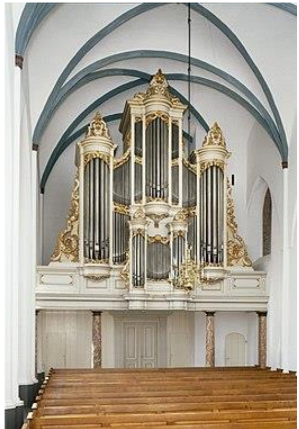
orgel 1965/1967