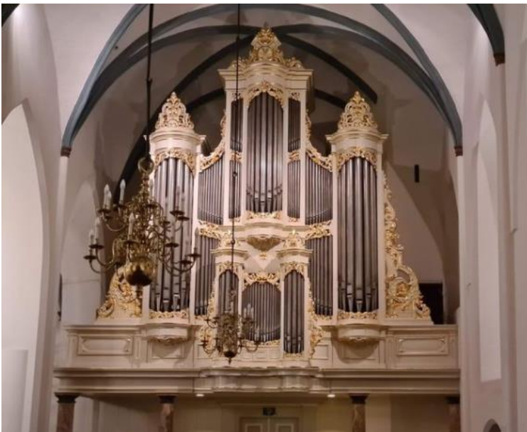
Foto's Orgel Oude Kerk 2020

Van september 2020 tot april 2021 werd een algehele renovatie uitgevoerd door de firma van Vulpen Orgelbouw te Utrecht. De belangrijkste aanpassingen hierbij waren vooral het terugbrengen van het hoofdwerk naar de oorspronkelijke dispositie en winddruk; de windvoorziening werd geheel vernieuwd en teruggebracht naar de oorspronkelijke opstelling met één grote magazijnbalg. De oorspronkelijke hogere winddruk is teruggebracht waardoor het orgel nu krachtiger klinkt. Daarnaast werd ook het schilderwerk opnieuw aangebracht in de oorspronkelijke lichte kleur en het bladgoud op de ornamenten is geheel vernieuwd. Bron: Wikipedia Oude kerk Ede