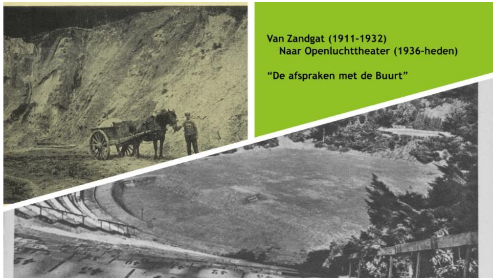
Van Zandgat (1911-1932) Naar Openluchttheater (1936-heden)