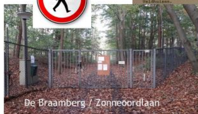
De Braamberg / Zonneoordlaan

Het bestuur van de Buurt Ede-Veldhuizen Van Borsselelaan 41 6711 JZ EDE 9.7.1995 no. 7 no. P 10210 no. Terrain EDE 17 september 1985. Van uw bovenaangehaalde brief delen wij u het volgende Gemeente Ede de algemene verkopen van onder andere terring het restaurant Calluna is gebouwd. Ingevolge de n hierna de voorwaarde verboden, dat dit perceel al- st als publiek wandelsterrein. Deze verplichting is gevoerd in de vorm van een zakelijk recht ten nutte van de Buurt Ede- velhuizen. verrijden van de akte van ruiling d.d. 23 december betrofend gedeelte van de rechten voortvloeiende uit het de plaats is gekomen een persoonlijke verplichting ver. De gemeente Ede als eigenares heeft toen op zich waarp het restaurant is gelegen, voor een ieder ter- welijk te doen blijven. Dit recht is evenwel niet van de tijd dat het Openluchttheater en/of de daarbij beho- vaak zullen zijn almede in die gevallen waarin bur- u der gemeente Ede dit noodzakelijk achten. vrige wandeling in derhalve indertijd het zakelijk geven, tusschen het recht is beperkt en nog verder is gebaar. Gelet hierop achten wij het overbodig een laten voortleven tusschen daar hier sprake is van een bij een restaurant. De aard van een restaurant is nu lijk is van bezoekers. In verband hiermede zal niet overgegaan worden tot een volledige afsluiting te gekende bepaalde tijden wel gebeurt is vanuit sheer verklaard. Onbehaarde gebouwen en dergelijke al het doelwit van vandelen.