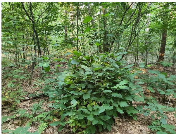
Uitgelopen Amerikaanse eiken stoof

Door selectief de besdragende bospest en de Amerikaanse eik af te zetten ten gunste van de gewenste boomsoorten zoals grove den, douglas, inlandse eik en struiken, zoals krent en lijsterbes wordt er gestuurd op een gevarieerd toekomstig bestendig bos.