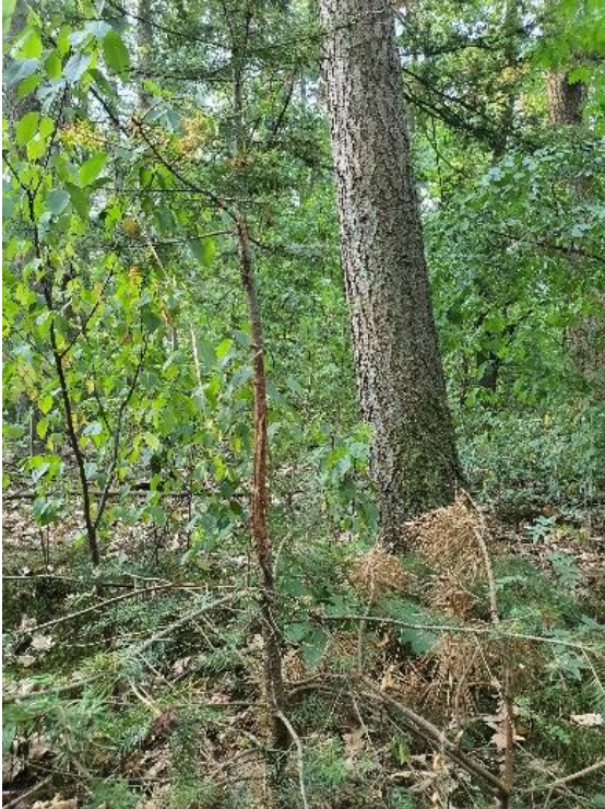
Veegschade reebok aan douglasverjonging

Het jachtgenot in het Buurtbos is tot 31 maart 2021 verhuurd aan de heren Van de Zandschulp en Sauer voor een huurprijs van € 25,00 per jaar. De jacht wordt uitgeoefend in een lokaal samenwerkingsverband van jagers, grondbezitters en geïnteresseerden, een wildbeheereenheid. De wildbeheereenheid voert het door de Faunabeheereenheid Gelderland vastgestelde faunabeheerplan uit. Zowel met de heer Van de Zandschulp als Sauer overleg ik enkele malen per jaar inzake het wildbeheer en toezicht in het buurtbos.