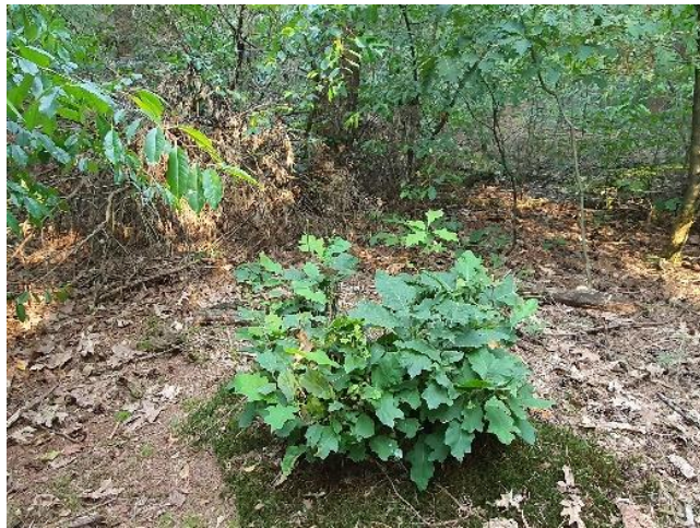
Door reeën afgevreten uitlopers Amerikaanse eik.

Ik vertrouw erop u hiermee voldoende te hebben geïnformeerd over het gevoerde beheer in het afgelopen jaar en ben gaarne bereid eventuele vragen te beantwoorden of onderdelen nader toe te lichten.