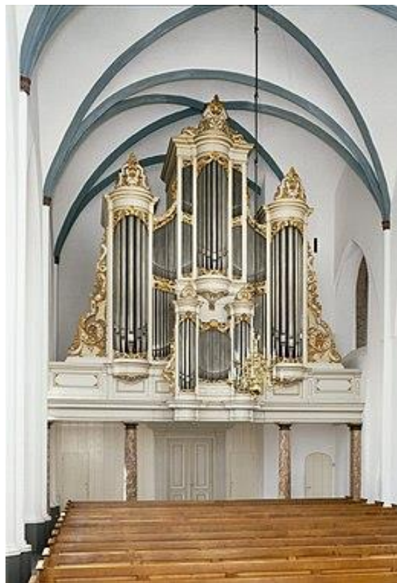
orgel 1965/1967