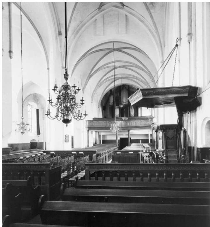
Foto: Het aangepaste Schwartz orgel rond 1955