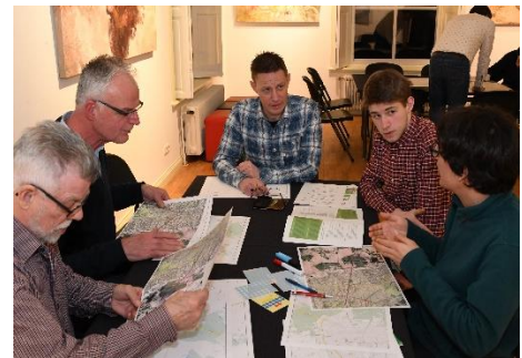
Impressie: Inspiratieavond Levend Landschap in Huis Kernhem