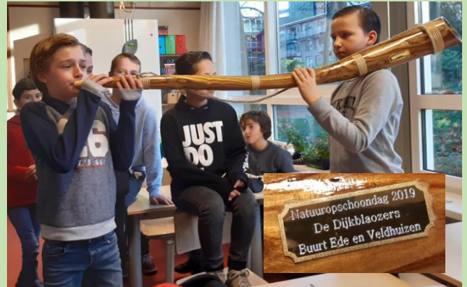
Aanbieden Midwinterhoorn ESV

De Dijkbloazers uit Lunteren hadden tijdens de Natuuropschoondag aangeboden voor de school die als eerste een “geschikte” Berkenstam zou brengen bij hun stand hiervan een Midwinterhoorn te maken. De ESV (Edese Schoolvereniging) werd de gelukkige winnaar.