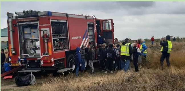
Edese brandweer bij Natuuropschoondag

Bij de organisatie van dit evenement werken wij nauw samen met St. Landschapsbeheer en Natuur en Landschap, gemeente Ede en het Bosbedrijf. Daarnaast werden wij ondersteund door o.a. de IVN, Brandweer Ede, de herder van de Edese Schaapskudde en de Midwinterhoornclub “de Dijkbloazers”.