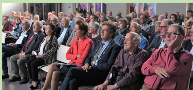
Buurtspraak 2019 Edesche Concertzaal