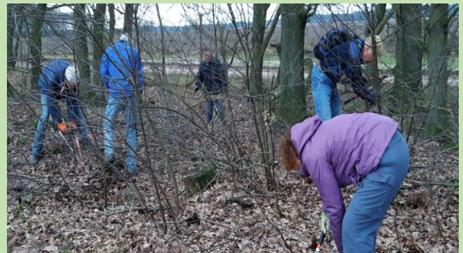
Bos & Heide groep op de Houtwal

> Wilt u ook meewerken aan dit project met enthousiaste groep? Wij horen het graag.