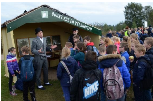
Natuuropschoondag 2016 Eder Heide