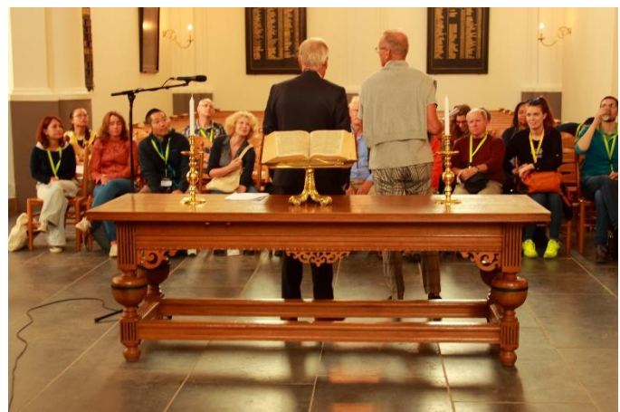
Impressie Common excursie Universiteit van Utrecht 2017

De groep wetenschappers werd op 13 juli 2017 door de Buurtrichter samen met een Buurtmeester ontvangen op het hoogste punt van Ede, de Paasberg, en ook oorspronkelijke buurtgrond, waarna met een korte wandeling langs de Trapakkers, waar vrijwilligers op traditionele wijze aan het werk waren, het Raadhuis werd bezocht. Hier gaf Johan Weijland, wethouder van o.a. Cultuur, een korte toelichting op Ede en werden door medewerkers van het Gemeentearchief de oude Buurtboeken en kaarten getoond. Daarna was er na een kort bezoek aan (het koor van) de Oude Kerk, de historische vergaderplaats van de Buurt, een bezoek aan de heidevelden rondom Ede en de schaapskooi op de Ginkelse heide. Na de lunch in Groot Zonneoord werden de Engen van de voormalige Buurt Doesburg bezocht en werd de excursie afgesloten met een bezoek aan de Doesburgermolen.