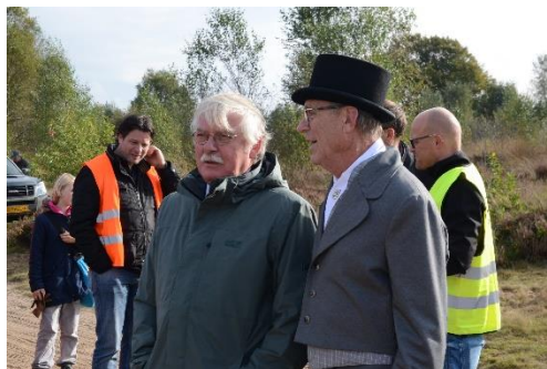
Burgemeester en Buurtrichter