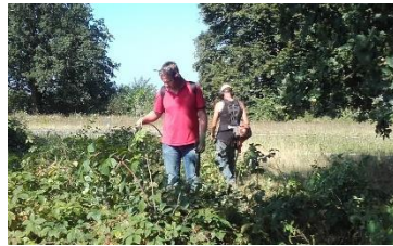
Opschonen berm N224